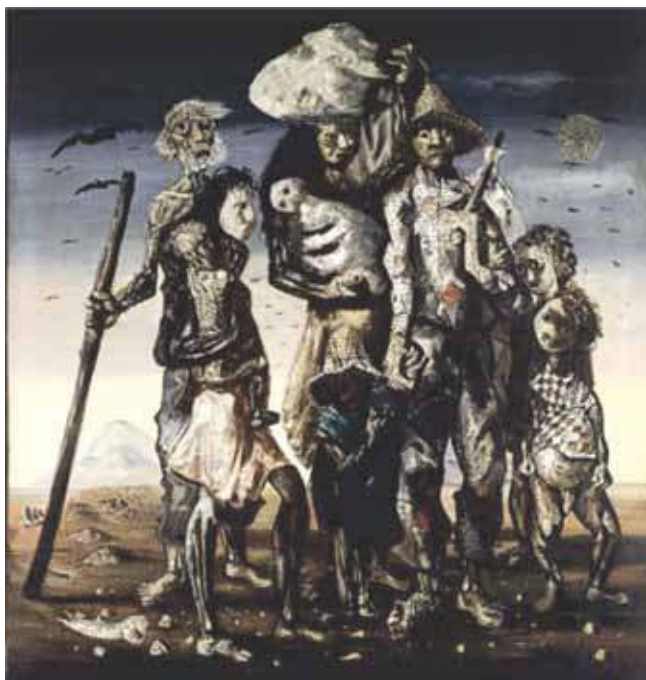
(Candido Portinari. Os retirantes [óleo sobre tela], 1944. MASP, São Paulo.)

Analise a imagem para responder às questões de números 07 e 08.