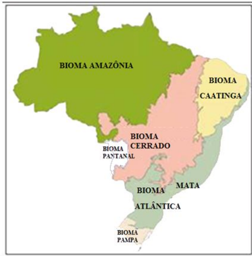
Fig. - Os Biomas do Brasil

Com 4,2 milhões de quilômetros quadrados, a Amazônia é o maior bioma brasileiro. A paisagem é dominada pela floresta amazônica e pelos mais de mil rios que constituem a maior bacia hidrográfica do mundo. O bioma oferece ainda outros ecossistemas: matas de terra firme, florestas inundadas, várzeas, igapós, campos abertos e manchas de cerrado. Contudo, apesar da baixa densidade demográfica da região, a exploração irracional de seus recursos naturais já afetou mais de 20% do bioma.