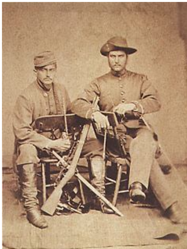
Oficiais brasileiros da Guerra do Paraguai (1868).